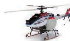
ヤマハ産業用無人ヘリ [FAZER R]